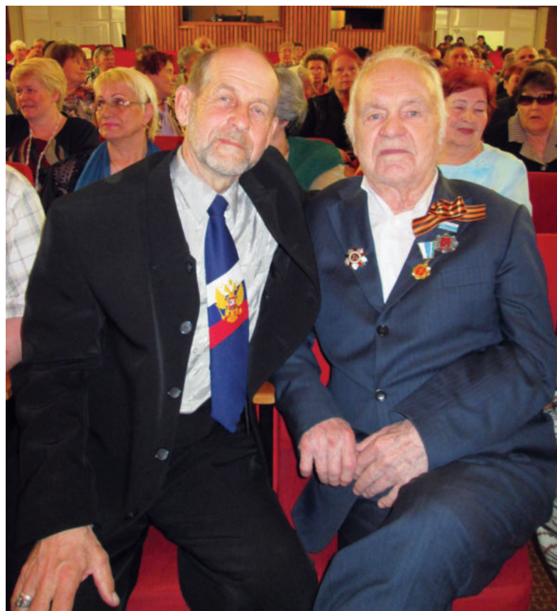
На юбилейном концерте Е.П. Родыгина в Ирбите.